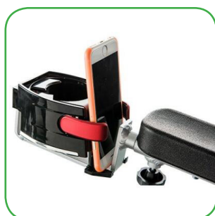
Handy-und Getränkehalter Kunststoff