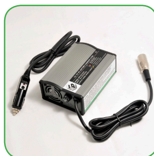
Ladegerät 1,5A für PKW