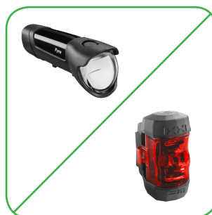
Set Beleuchtung VDO (je 2 Stück)